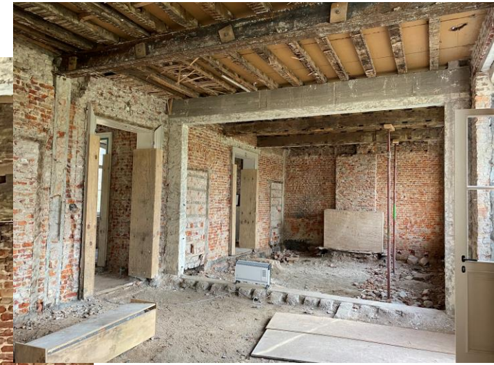
Foto's huidige toestand