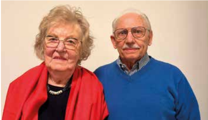
Briers – Vandecaetsbeek, Bilzen