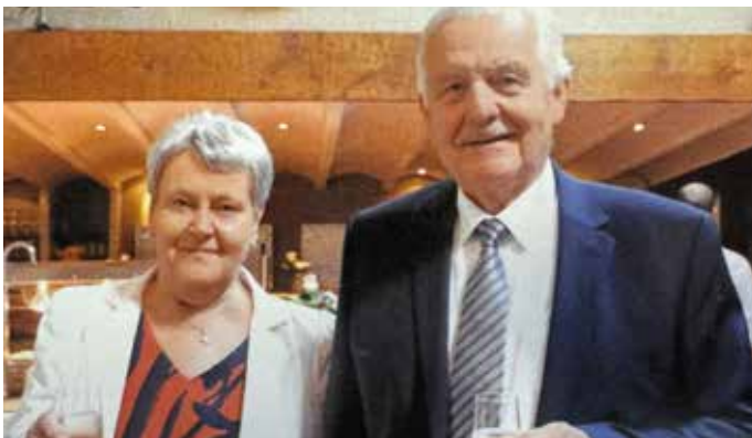
Hayen – Dehasque, Schoonbeek